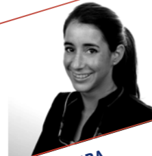
CARME RIERA Restauraciones adhesivas indirectas posteriores, ¿confiamos en la adhesión?