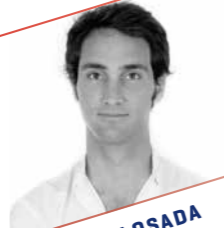
MANUEL LOSADA La cirugía endodóntica como herramienta en el tratamiento de casos en el sector anterior