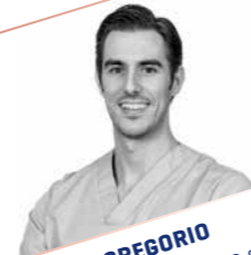
CÉSAR DE GREGORIO Traumatismos dentales con daño grave al ligamento periodontal: nuevos protocolos con ferulizaciones activas