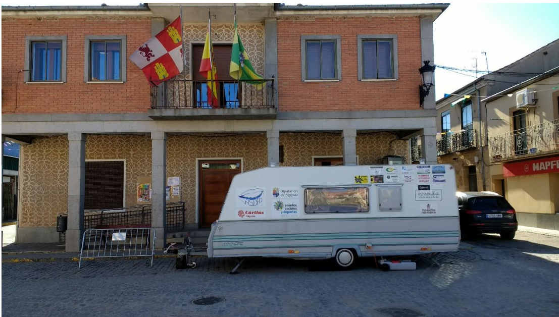
Unidad dental móvil ASDAS en Cantimpalos