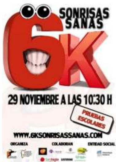
Cartel de la primera Carrera Solidaria. Zaragoza, noviembre de 2015.

también se plantean acciones cuyo público meta es más amplio, como, por ejemplo, stand a pie de calle con motivo de la celebración del Día Mundial del Higienista Dental, o stand en actividades de recaudación de fondos para el Banco de Alimentos, o incluso la celebración de la I 6K Sonrisas Sanas en Zaragoza.