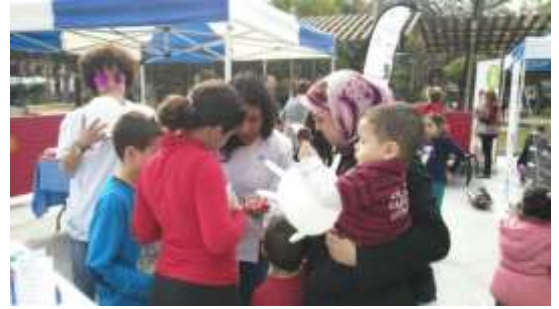
Stan a pie de calle en un acto de recaudación de fondos para el Banco de Alimentos de Fuengirola. Noviembre de 2015.