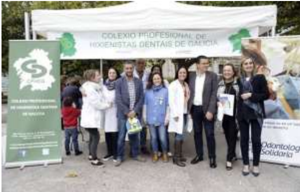
Stan a pie de calle de Promoción de la Salud Oral el Día Internacional del Higienista Bucodental. En la foto, con el alcalde de A Coruña. 17/06/2016.