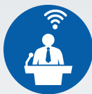
ZI LIVE WEBCASTS