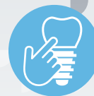
ZIPATHWAYZ ® PROGRAMS