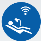
ZI LIVE CLINICAL

Póngase en contacto con nosotros para más información sobre próximos programas de formación: