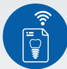
ZI LIVE CASE PRESENTATIONS