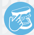
ZI IMPLANT SKILLZ ® SERIES