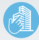
ZIMVIE INSTITUTE PROGRAMS